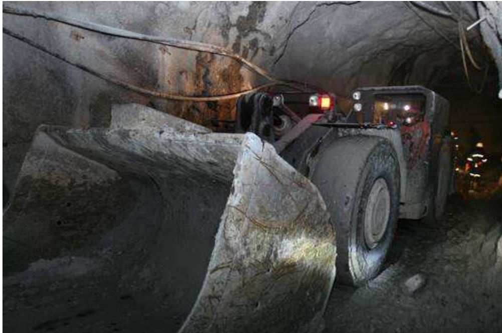
Túnel de la minera canadiense Cuzcatlán, ubicada en OaxacaFoto María Meléndrez Parada Angélica Enciso L.

Hay pruebas de pagos extraoficiales que recibió el presidente municipal de Chicomuselo